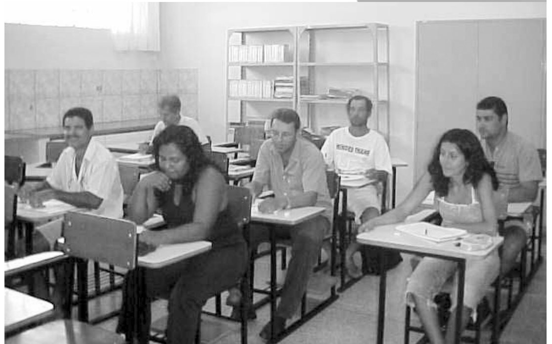
Servidores assistindo aula

Com o trabalho desenvolvido junto aos funcionários, foram efetivadas 52 inscrições para o programa: 18 de 1ª a 4ª série e 34 para 5ª a 8ª série. Dados revelam que a média de idade dos funcionários inscritos é de 45 anos. Na Fazenda de Pesquisa as aulas são ministradas no refeitório, às segundas e quartas-feiras, das 15 às 18 horas (1ª a 4ª) e às terças e quintas-féias, no mesmo horário, para os inscritos da 5ª a 8ª. Em Ilha Solteira as aulas são ministradas no Núcleo de Apoio ao Ensino de Ciências e Matemática (NAECIM). Os inscritos de 1ª a 4ª séries têm aulas às