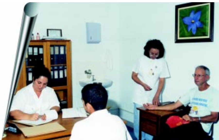
Atendimento à servidores

Segundo o médico, o atendimento na UNAMOS é diferenciado do hospital. “Quando o paciente recorre ao atendimento no hospital é porque tem um quadro que necessita de tratamento emergencial. Já o paciente da UNAMOS busca mais a prevenção”, explicou o médico, revelando estar satisfeito com o trabalho realizado até o momento.