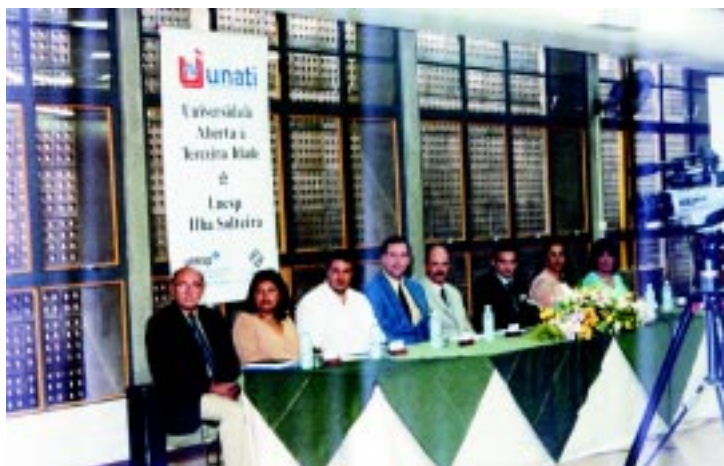
Mesa diretora (inauguração)