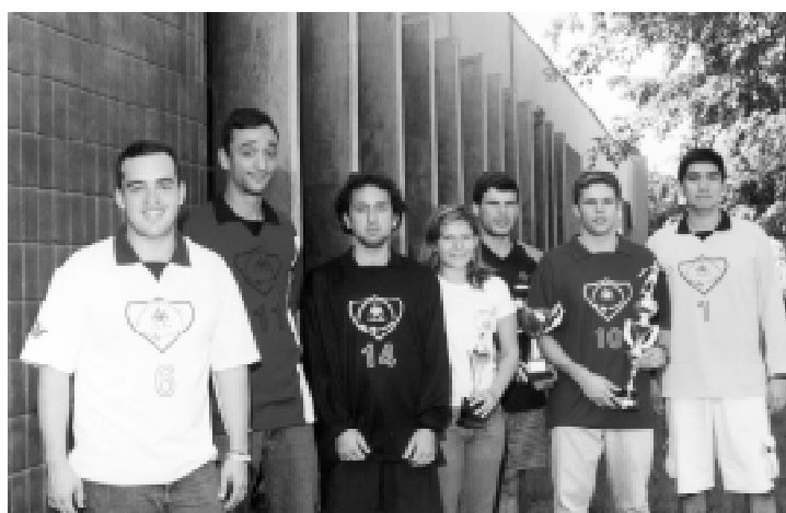
Novos uniformes A.A.A.