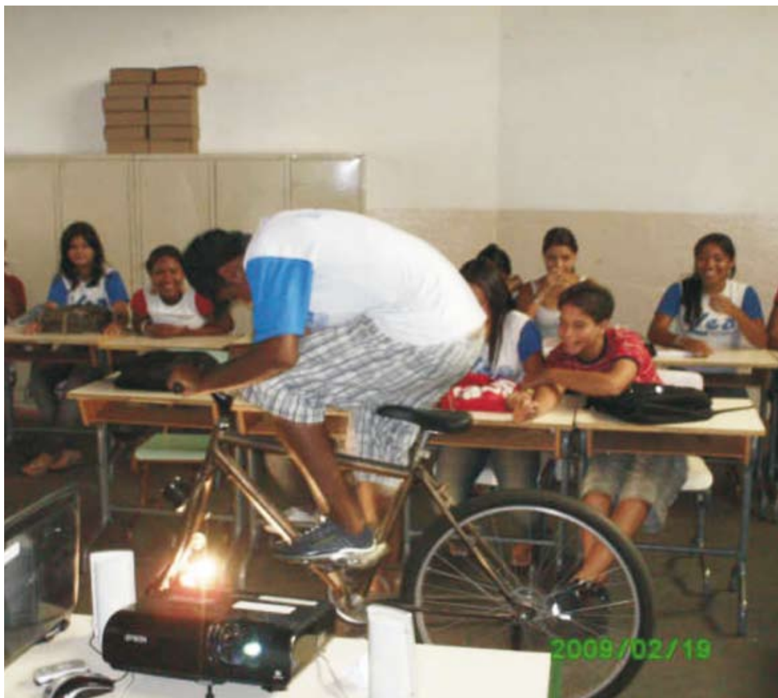
Bicicleta geradora de energia elétrica em uso durante a palestra

Durante as palestras, foi feita uma interação com os alunos através do uso de uma bicicleta geradora de energia, onde eles eram convidados a pedalar e assim “sentir” a dificuldade em gerar energia para acender as lâmpadas. Desta forma, realizou-se uma analogia, entre gerar energia