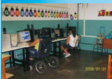
Utilização da informática como ferramenta de apoio pedagógico para educação de alunos com necessidades especiais.

Há muito tempo uma concepção de Universidade, na qual acreditamos, é baseada no tripé: ENSINO, PESQUISA e EXTENSÃO. O projeto de uma Universidade deve incluir esses três importantes aspectos, de tal maneira, que estes sejam imprescindíveis para a sua existência. Quando falamos em EXTENSÃO, pretendemos retribuir à Sociedade um conhecimento efetivo que ajude a solucionar problemas e a promover o seu desenvolvimento em diversos aspectos, como o social e o cultural. A proposta do projeto "Informatizar para