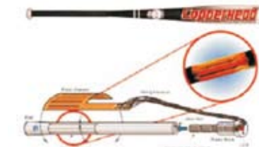
Figura 2 – Bastão de beisebol com sistema para atenuar vibrações (Akhras, 2000)