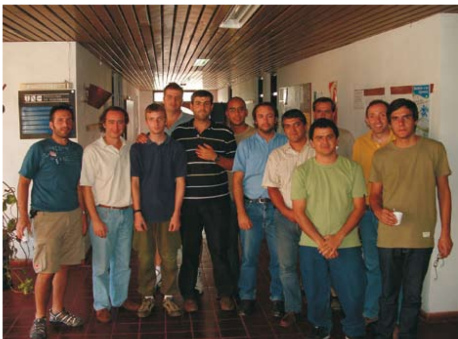
Alunos participantes do curso sobre tecnologia embarcada